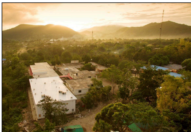
Figure 1 : Vue aérienne de l'Hôpital Saint-Boniface

Sur la péninsule de Tiburon en Haïti, un modèle centralisé de production d'oxygène est utilisé. Une centrale alimentée à l'énergie solaire à l'Hôpital Saint-Boniface remplit de 60 à 100 bouteilles d'oxygène chaque jour. Les bouteilles sont ensuite transportées vers un entrepôt à Les Cayes, soit à 2 heures à l'ouest de l'hôpital. Depuis Les Cayes, l'oxygène peut être distribué à 16 installations ayant besoin d'oxygène dans un rayon de 2 à 4 heures de route de l'installation de stockage.