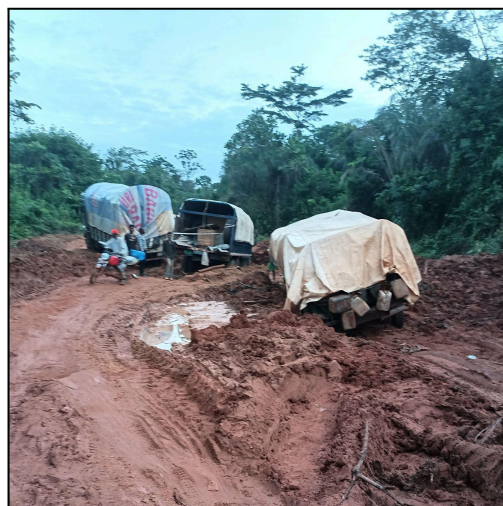
Figure 2 : Entrave routière au Libéria en raison de routes boueuses

Un modèle décentralisé de production d'oxygène est utilisé au Libéria. La redondance de nombreuses petites centrales PSA élimine les temps de transport et les problèmes logistiques qui peuvent prévaloir dans un modèle centralisé. L'état des routes du Libéria représente le plus grand obstacle au transport