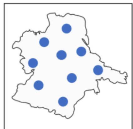
Figure 3: Modèle décentralisé

Chave para o Hospital: Production d'oxygène Non production d'oxygène Stockage d'oxygène