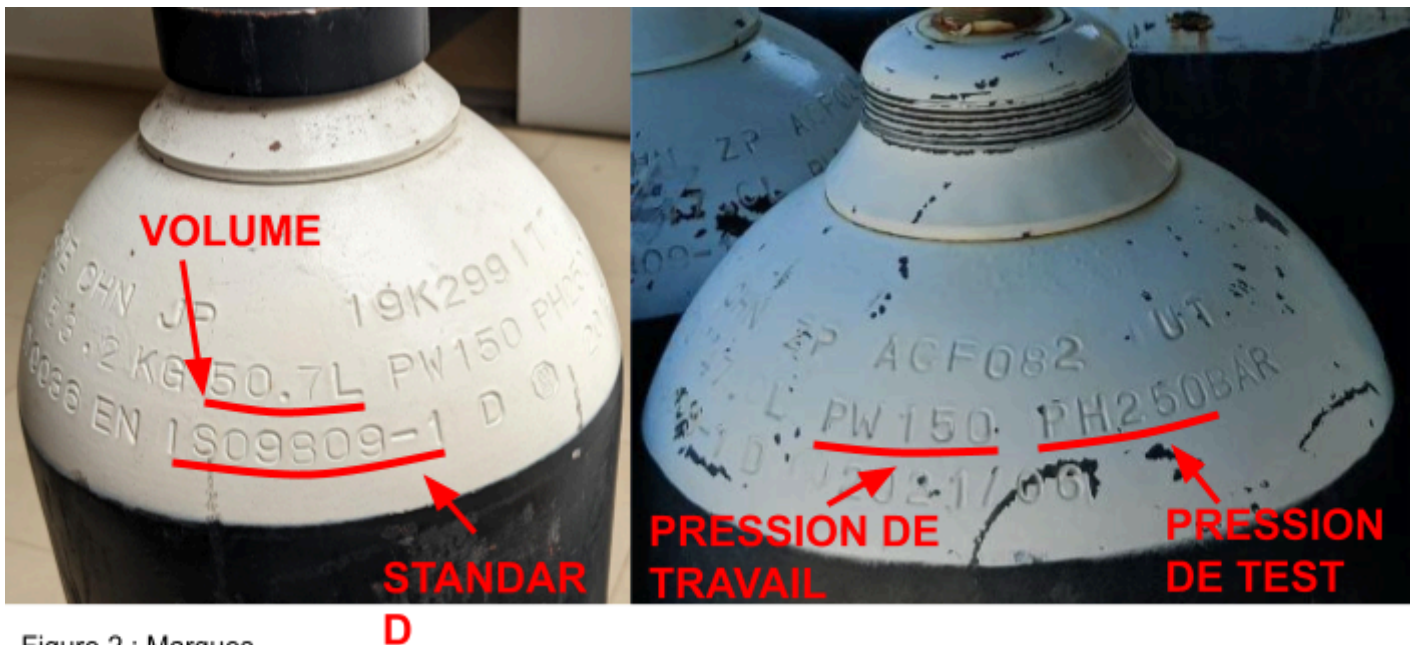
Figure 2 : Marques